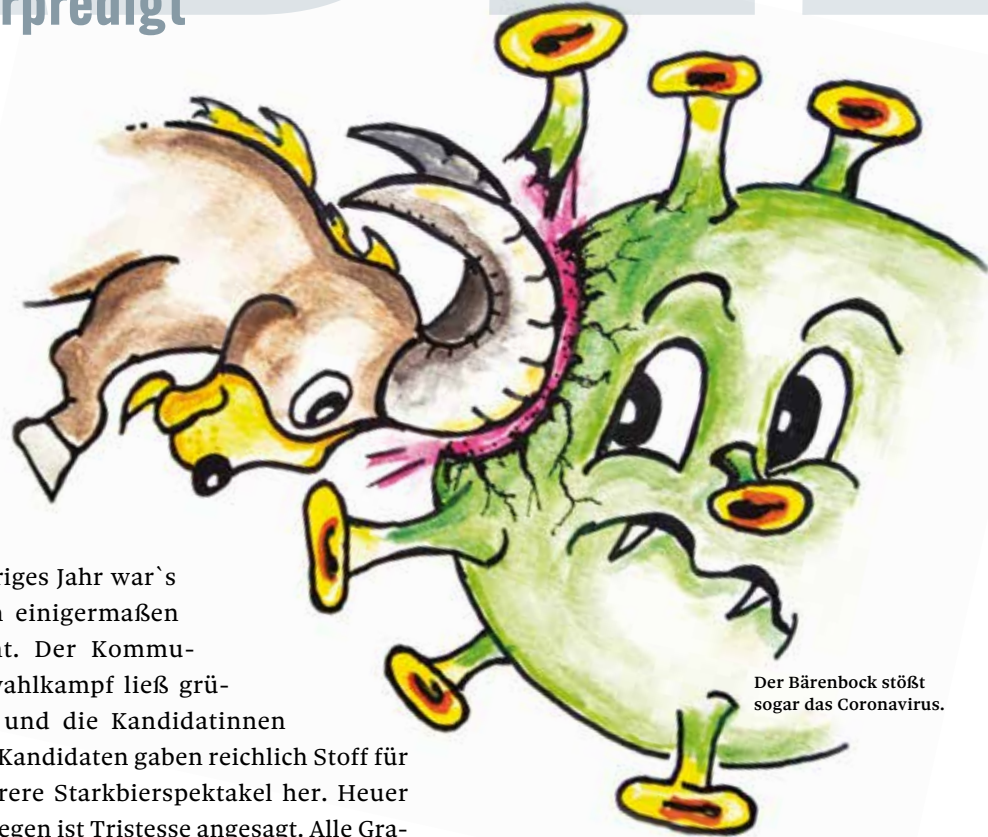
Der Bärenbock stößt sogar das Coronavirus.