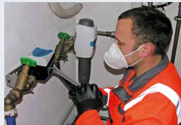
Ein Mitarbeiter des Wasserwerkes beim Montieren eines neuen Wasserzählers.

Das Nachrüsten eines Wasserzählerbügels bei allen Trinkwasserzähleranlagen ist vorgeschrieben, da keine Spannungen auf den Zähler einwirken dürfen und ein Rückschlagventil vorhanden sein muss. Die Installation eines Wasserzählerbügels erfolgt durch einen von Ihnen beauftragten, in das Installationsverzeichnis der Stadt Grafenau eingetragenen Installateur oder im Zuge des Zählerwechsels durch das städtische Wasserwerk gegen Verrechnung. Die notwendige Absperrung Ihres Hausanschlusses (und die Abstimmung der Positionierung Ihres Wasserbügelzählers) erfolgt durch das Wasserwerkpersonal ohne zusätzliche Kosten.