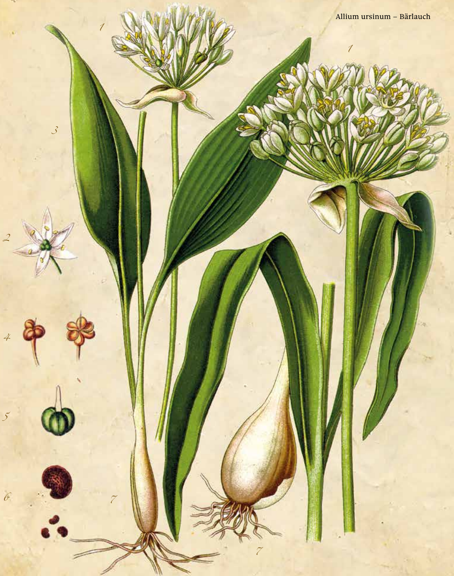
Bärlauch ( Allium ursinum ) 1 Blütenoldle 2 geöffnete Blüte 3 Blätter 4 Samenkapsel 5 Frucht 6 Samen 7 Zwiebel