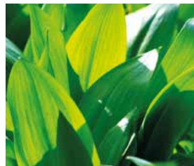
(Text und Fotos: ur-Redaktion)