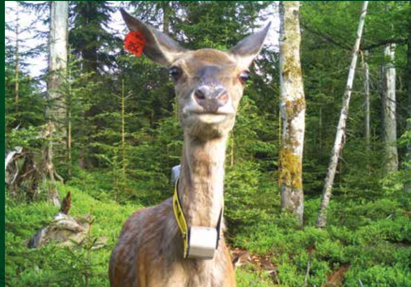
Besenderte Rothirsche werden auch immer wieder mittels Wildkameras fotografiert.

Übrigens: Drittmittel akquiriert der Nationalpark auch in anderen Bereichen. Gerade im Sachgebiet Nationalparkzentren und Umweltbildung sind traditionell viele von der EU geförderte Interreg-Projekte beheimatet. So flossen 2020 trotz Corona-Einschränkungen weitere knapp 83.000 € in die Arbeit des Nationalparks – unter anderem für Bildungsinitiativen im Jugendwaldheim und im Wildniscamp am Falkenstein.