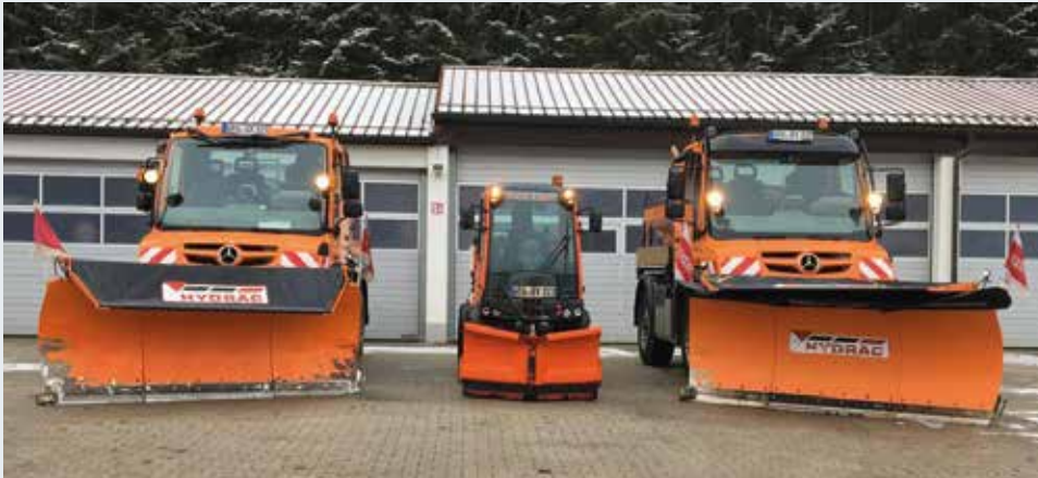
Bis zu zehn Bauhof-Fahrzeuge sind im Winterdienst im Einsatz, um die Straßen schneefrei zu machen.

durchaus weitläufig: Rund 500 km Straßen und Wege müssen geräumt, 270 km zusätzlich gestreut werden. Ab drei Uhr morgens sind bis zu 10 eigene und 2 Fremdfahrzeuge viele Stunden im Dauereinsatz, um den Bürgerinnen und Bürgern immer gefahrlos befahrbare Fahrbahnen zu bieten. Auch 18 Großparkplätze mit knapp 2000 Stellplätzen werden bereits in den Nachtstunden präpariert, damit sie tagsüber uneingeschränkt genutzt werden können. „So wenig Split und Salz wie möglich, aber so viel wie nötig“, sagt Bauhofleiter Florian Simböck zum Materialeinsatz. In der Summe hieß das in der vergangenen Saison 1200 t Split und 500 t Salz. Zusätzlich zu Unimogs, Holder und Lader sind die Männer bei Schneefall auch noch mit Handtrupps beim Schaufeln unterwegs. Zusätzlich zur städtischen Leistung gibt es natürlich auch für alle Grundstückbesitzer einige Verpflichtungen für den Winterdienst. Die Stadt Grafenau dankt in diesem Zusammenhang für die gute Zusammenarbeit!