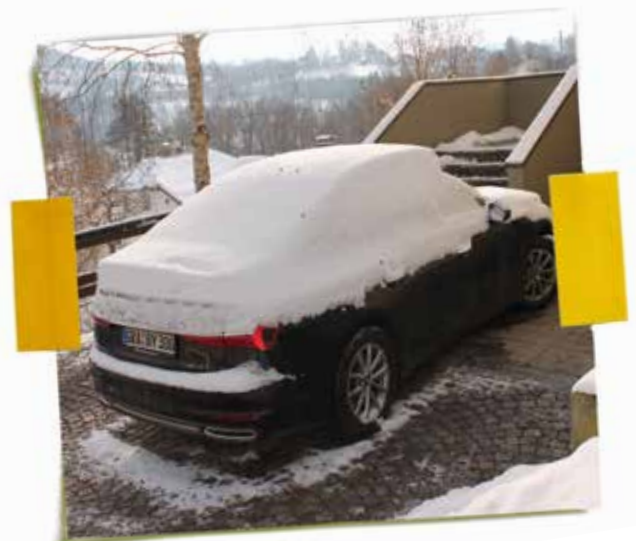
Der Bürgermeister-Dienstwagen versank mangels Nutzung diesen Winter oft unter einer Schneehaube.

W arum die Stadt Grafenau sich für den neuen Bürgermeister ein teures Dienstauto leistet, ist dem Steuerzahler nicht immer vermittelbar. Tagelang steht der schwarze Audi ungenutzt vor dem Rathaus. Dicke Schneehauben auf dem Dach des Pkw zeugen davon (siehe Bild). Das sollte aber dem Umweltbewusstsein unseres Bürgermeisters geschuldet sein. Er nutzt nämlich als derzeit einziger Passagier die Waldbahn. Er ist überhaupt ein Eisenbahn-Fan und hat immer noch den Plan im Kopf, eine Bahnverbindung zwischen Grafenau und der Kreisstadt Freyung herzustellen. Sein Kämmerer, der Hackl Florian, singt ihm aber jeden zweiten Tag abgewandelt ein Lied aus Leo Falls Operette „Der fidele Bauer“: „Mayerle, Mayerle hab ka Geld.“