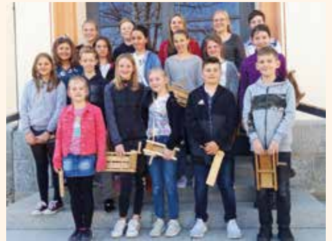
Die Hausinger Ministranten freuen sich jedes Jahr auf 's Ratschen. Wegen Corona wird derzeit ersatzweise auf dem Balkon oder der Terrasse geratscht.

gilt es, sich mit Fleiß und Lautstärke Gehör und Respekt zu verschaffen. Der Älteste, der schon am häufigsten beim Ratschen dabei war, hat in den Dörfern verschiedene Namen. So heißt er in Lichteneck „Kapo“, in Rosenau wird er „Meister“ oder auch „Oa-Koda“ genannt. Er gibt den Ton an und zeigt das Ende des Ratschens an, indem er seine Ratsche in die Höhe hebt, ein „Nachratschn“ ist nach diesem Kommando nicht gerne gesehen. In Rosenau beispielsweise droht bei mehrfachen Verstößen sogar ein Ei-Abzug. Der Jüngste geht hinten an. Früher war das Ratschen nur den Buben vorbehalten, heute sind in den Dörfern meistens die Ministranten oder eine bunte Gruppe Dorfkinder unterwegs, wie unsere Nachfragen in den Ortsteilen ergeben haben. In Lichteneck beispielsweise wurde erst 1993 mit einem Beschluss in der Dorfversammlung das Ratsch-Recht auch den Mädchen zugestanden. Vielfach haben jetzt auch die Ministranten das Ratschen übernommen, wie etwa in Grafenau oder in Haus i. Wald.