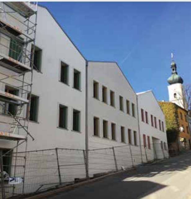
Während noch die letzten Bauarbeiten ausgeführt werden, zieht in das neue Finanzamts-Gebäude am Stadtberg im März Leben ein.

arbeiter in Voll- und Teilzeit werden dort abwechselnd arbeiten. Bearbeitet werden sollen dort in erster Linie Münchner Steuerfälle. 7,8 Mio. Euro investiert der Freistaat Bayern in den Neubau am Oberen Stadtberg. Mit den Bauarbeiten wurde im April 2019 begonnen, jetzt ist das Gebäude bezugsfertig. Planungsgrundlage waren der Städtebauliche Rahmenplan und die Gestaltungssatzung der Stadt Grafenau. Hieraus entwickelte sich der 3-geschossige Neubau als U-förmige Randbebauung zu den begrenzenden beiden Straßen. Das Gebäude wurde in Massivbauweise (Lochfassade) errichtet. Die Dachformen wurden, der Umgebung angepasst, als Satteldächer ausgeführt. Auf rund 1.500 m 2 Nutzungsfläche sind 35 Büros mit den dazugehörigen Besprechungsräumen, Sanitär-, Technik- und Funktionsräumen entstanden. Der geplante energetische Standard entspricht den erhöhten Anforderungen eines Passivhauses.